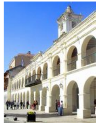
Mahlzeiten inklusive: Frühstück

Bevor wir am Nachmittag unsere lange Nachtfahrt durch die argentinische Pampa antreten, haben wir am Vormittag noch Gelegenheit die Stadt zu erkunden. Mit ihren ca. 600 000 Einwohnern bietet Salta alle Vorzüge einer großen modernen Stadt. Bummeln Sie doch ganz entspannt durch diese hübsche Stadt und bestaunen sie die verschiedenen Kirchen und Kathedralen. Es bietet sich auch die Möglichkeit mit einer Gondelbahn auf den Cerro San Bernardo zu fahren und Salta aus einer völlig neuen Perspektive kennenzulernen. Auch haben wir genug Zeit um noch das Nötige für die uns erwartende Nachtfahrt nach Iguazu , im subtropischen Nordosten Argentiniens, zu besorgen. Diese sehr lange Strecke befahren wir in einem der komfortablen argentinischen Linienbusse mit großen bequemen Liegesesseln. Die südamerikanischen Busse können sich die europäischen übrigens ernsthaft als Vorbild nehmen. Lehnen Sie sich entspannt zurück und genießen Sie die Fahrt.