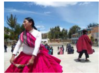
Mahlzeiten inklusive: Frühstück, Abendessen

Heute erwartet uns nicht nur eine landschaftliche Idylle, sondern auch ein Einblick in das traditionelle Leben der einheimischen Bauern . Nach einem leckeren Frühstück setzen wir mit einem Motorboot zur Sonneninsel über. Am Vormittag wandern wir über Sonneninsel in nördlicher Richtung, genießen die Landschaft und erfahren vieles über die Sagen, Mythen und Traditionen der Quechuas und Aymaras. Am frühen Nachmittag schippern wir mit dem Boot zur Bauerngemeinde Santiago de Okola . Die freundlichen Bauern aus Okola erwarten uns mit einem leckeren typisch bolivianischen Essen. In dieser Gegend gibt es kaum Touristen und wir übernachten heute bei Gastfamilien, welche für uns in ihren Häusern Zimmer eingerichtet haben. Die Unterkünfte am heutigen Tag sind äußerst einfach, jedoch sehr liebevoll hergerichtet. Wer noch Lust hat macht am Sandstrand einen kleinen Spaziergang. Um den Tag entspannend abzuschließen, machen wir es uns abends rund um das Lagerfeuer gemütlich.