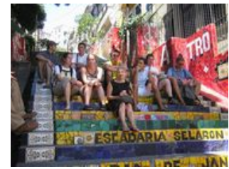
Mahlzeiten inklusive: Frühstück, Mittagessen, Abendessen

Die heutigen Mahlzeiten beziehen sich auf die Mahlzeiten während des Fluges.