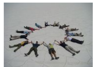
Mahlzeiten inklusive: Frühstück, Mittagessen

Das Aufstehen fällt uns heute bestimmt nicht schwer, denn das spektakuläre Naturhighlight, der Salar de Uyuni , steht uns bevor! Vorher fahren wir jedoch zum Cementerio de Trenes , wo uns die Wracks mehrerer Züge aus einer vergangenen Zeit den Atem verschlagen. Kurze Zeit später halten wir in dem Ort Colchani, welcher fast ausschließlich von der Salzproduktion lebt. Mit viel Sonnencreme im Gesicht gleiten wir mit Jeeps über den Salzsee hinweg und bestaunen dieses einmalige Naturschauspiel aus stechend weißem Salz und azurblauem Himmel. Diese bizarre, schöne Weite wird uns den ganzen Tag begleiten und verzaubern. Auf der Insel Inkahuasi haben wir die beste Aussicht über den Salar. Beim Spaziergang über die Insel werden wir viele tolle Fotomotive entdecken und die einzigartige Vegetation bestaunen können. Unterwegs suchen wir uns einen schönen Platz für unser Mittags-Picknick. Am Abend sind wir zurück in Uyuni. Unser Nachtzug nach Tupiza fährt nach Mitternacht ab und wir verbringen die Zeit bis dahin in einer der gemütlichen örtlichen Kneipen oder ruhen uns im Hotel aus.