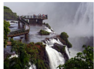
Mahlzeiten inklusive: Frühstück, Abendessen

Nach einem reichhaltigen Frühstück fahren wir an die argentinisch-brasilianische Grenze, zu den beeindruckenden Wasserfällen von Iguazu . Über 275 Wasserfälle stürzen sich über eine Ausdehnung von 2,7km in die Tiefe. Wir gelangen mit einer kleinen Eisenbahn zum besten Aussichtspunkt der Wasserfälle, dem " Garganta del Diablo ". 80m stürzen sich die tosenden Wassermassen direkt an der Abbruchkante vor uns in die Tiefe. Wie der Name schon vermuten lässt, ist dies der höchste Teil der Iguazu-Wasserfälle: ein gigantisches Wasserspektakel, das Getöse, die Gischt und die imposante Schönheit und Kraft dieses Naturschauspiels wird einen bleibenden Eindruck hinterlassen. Verschiedene Aussichtspunkte entlang der Stege bieten eine abwechslungsreiche Perspektive. Wer mag, kann auch auf eigene Faust mit einem Schnellboot bis ganz knapp an die Wassermassen heranfahren, doch eine frische Dusche bleibt dann nicht aus. Am Abend lädt uns unser Reiseleiter zu einem leckeren Abendessen ein und zusammen zelebrieren wir die gemeinsam verbrachten Höhepunkte der letzten Tage.