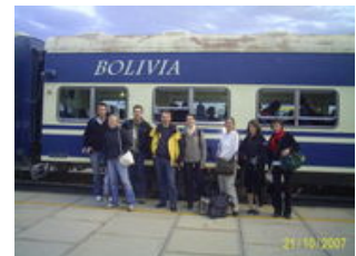
Mahlzeiten inklusive: Frühstück, Mittagessen

Unsere Reise führt uns weiter nach Süden in das Drei-Länder-Eck Bolivien-Chile-Argentinien. Mit einem privaten Bus fahren wir am frühen Nachmittag Richtung Oruro und genießen die weite Andenlandschaft. In Oruro findet auch der zweitgrößte Karneval Südamerikas statt, der von der UNESCO zum Weltkulturerbe erklärt wurde. Im Februar bzw. März füllen sich die Straßen und für vier Tage verwandelt sich Oruro zu größten Partymeile Boliviens. Im Museum und der Kapelle "Virgen del Socavon" erfahren wir alles Wissenswertes zum Thema Karneval . Am Nachmittag fahren wir mit dem Zug Richtung Uyuni . Der Zug verfügt über ein Bordrestaurant, in dem Sie Ihr Abendessen einnehmen können. Nachts kommen wir in Uyuni an, wo wir am Bahnhof erwartet und ins Hotel gebracht werden. Uyuni ist ein Eisenbahner- und Bergbauort der Dank seiner Nähe zum Salzsee immer mehr an touristischer Bedeutung erlangt. Da Uyuni mitten auf dem kargen Hochland auf fast 4.000m Höhe liegt kann es hier abends, v.a. in den Monaten Juni bis September ziemlich kalt (teilweise Minus-Grade) werden.