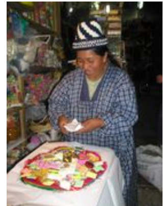
Mahlzeiten inklusive: Frühstück, Mittagessen

Heute lernen wir La Paz kennen. Diese typische südamerikanische Großstadt ist schon etwas ganz Besonderes: Das immer lebendige Zentrum dieser Metropole präsentiert neben Hochhäusern auch schöne Straßenzüge aus der Kolonialzeit, von einem Aussichtspunkt erleben wir einen imposanten Ausblick über die Stadt. Wir schlendern durch das historische Zentrum und besuchen das Marktviertel mit den berühmten Hexenmarkt. In La Paz kann man viel entdecken und einfach nur staunend durch die kleinen Straßen laufen. Beim Mittagessen lernen wir das viventura Team unserer Partneragentur in La Paz kennen. Wir probieren bolivianische Leckereien, tauschen unsere Eindrücke der Tour aus und holen uns Tipps für die Weiterreise. Etwas außerhalb der Stadt liegt das Tal Valle de la Luna - eine beeindruckende Mondlandschaft, in der wir uns wie in eine andere Welt versetzt fühlen. Tausenden Felsen, Felsspalten, Erdhügeln und kraterähnliche Formationen wurden im Laufe von Millionen Jahren durch Erosion, starke Regenfälle und Temperaturschwankungen geformt. Die Farben reichen von hellrot bis tiefbraun.