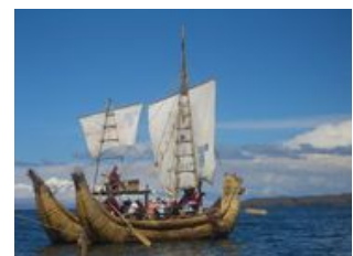
Mahlzeiten inklusive: Frühstück, Abendessen

Ein absolutes Highlight dürfen wir heute besuchen: die schwimmenden Inseln der Uros . Hier erklärt uns unser lokaler Guide Wissenswertes über die Schilfinseln, die komplett aus der Totoro Pflanze bestehen und gibt uns einen Einblick in das Leben der Uros Gemeinde. Mit diesem letzten peruanischen Eindruck brechen wir auf Richtung Bolivien, dem ärmsten der südamerikanischen Länder. Auf dem Landweg passieren wir die bolivianisch-peruanische Grenze und geht es nach Copacabana, dem wichtigsten bolivianischen Wallfahrtsort! Wenn wir es zeitlich schaffen, können wir den Kalvarienberg erklimmen, von dessen Gipfel aus wir eine atemberaubende Aussicht auf den Titicacasee haben werden. Am Fuße des Sündenbergs bieten Schamanen und Hexer ihre Dienste an. Aber keine Bange Sie müssen hier nicht mitmischen. Sie können auch einfach die Wallfahrtskirche besuchen und Ihre Seele in einem der zahlreichen Cafés baumeln lassen.