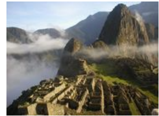
Mahlzeiten inklusive: Frühstück, Abendessen

Heute machen wir uns besonders früh auf den Weg, um den Anblick Machu Picchu und seine Atmosphäre vor allen anderen Tagestouristen genießen zu können. Die verlorene Stadt, welche auf 2360m liegt, gibt bis heute Rätsel auf. Bisher weiß niemand warum die Stadt gerade hier erbaut wurde und für wen. Unser lokaler Guide wird uns bei unserem gemeinsamen Rundgang durch die Ruinen viele interessante Fakten und Erläuterungen geben. Später werden wir die Ruinen auf unsere ganz eigene Weise erkunden können. Gegen Mittag, wenn sich die Hänge mit den Tagestouristen füllen, können Sie zum Sonnentor oberhalb der sagenumwobenen Inka-Stadt aufsteigen. Der Aufstieg ist auf Grund der Höhe relativ anstrengend, deswegen empfehlen wir Ihnen diesen nur, wenn sie an die Höhe gewöhnt sind und über eine gute Kondition verfügen. Aber die Anstrengung lohnt sich, Sie werden mit einem atemberaubenden Ausblick belohnt. Alternativ können sie auch einen Spaziergang zur Inkabrücke machen. Am Nachmittag treten wir die Reise mit Zug und Bus nach Cuzco an.