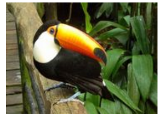
Mahlzeiten inklusive: Frühstück, Abendessen

Nach einer Nacht in den endlosen Weiten der argentinischen Pampa erreichen wir am Vormittag die Grenzstadt Puerto Iguazu . Nach unserer Ankunft haben wir genügend Zeit um uns am Pool zu Erholen. Das Klima ist sehr warm und entspannt können wir den Tag ausklingen lassen. Kosten Sie doch einmal den köstlichen argentinischen Wein!