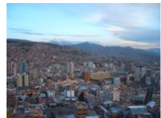
Mahlzeiten inklusive: Frühstück

Nach dem Frühstück in Okola besteigen wir unseren Bus und fahren über das landwirtschaftlich geprägte Hochland am Fuße der schneebedeckten Gipfel der Königskordillere Richtung La Paz. Nach etwa drei Stunden erreichen wir das Ballungsgebiet von La Paz und El Alto . In El Alto halten wir bei dem von viSozial unterstütztem Projekt Luz de Esperanza und lernen einiges über das Leben in den Straßen von El Alto. Die Jugendlichen im Projekt sind immer für ein Fußballspiel zu haben und freuen sich wenn wir die Herausforderung annehmen! Nähere Infos zu diesem Projekt gibt es auf den Seiten von viSozial. Anschließend geht es weiter nach La Paz wo wir am Nachmittag ankommen. Durch die einmalige Lage (Talkessel zwischen 3.400 - 4.070m) mitten in den Anden und mit dem atemberaubenden Blick auf den schneebedeckten Gipfel Illimani, lässt La Paz auch unser Herz höher schlagen. Den Abend verbringen wir ganz nach unserer Vorstellung. Wie wäre es beispielsweise mit einer typischen Folkloreshow.