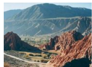
Mahlzeiten inklusive: Frühstück, Mittagessen

Heute wartet wieder ein anderes südamerikanisches Land auf uns: Argentinien! In Jeeps fahren wir durch die Gebirgswelt der Anden bis zum Grenzort La Quiaca, wo wir in unseren argentinischen Transport umsteigen. Die Fahrt führt uns auf einer gut asphaltierten Straße durch die berühmte Quebrada de Humahuaca - eine vom Fluss Rio Grande in die Berge eingeschnittene Schlucht. Diese karge vegetationsarme Schlucht ist bekannt für die in verschiedenen Farben leuchtenden Gesteinsschichten, die besonders bei Sonnenauf- und Sonnenuntergang schillernd zur Geltung kommen. In die 150km lange Schlucht sind vereinzelt kleine Dörfer eingebettet, die hauptsächlich von den Indios bewohnt sind und teilweise zum UNESCO Welterbe gehören. Auf der Fahrt durch den Taleinschnitt halten wir bei jeder Gelegenheit, um uns die Beine zu vertreten und natürlich die Landschaft zu fotografieren. Gegen Abend kommen wir in Salta an und können die leckere argentinische Küche mit einem typischen Asado und gutem Wein probieren.