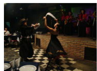
Mahlzeiten inklusive: Frühstück

Salta oder auch wie die Einheimischen sie nennen 'die Schöne' hat ihren kolonialen Baustil und Charme beibehalten und liegt auf entspannenden 1200m Höhe. Den heutigen Tag haben wir frei und können nach Lust und Laune ausschlafen oder die Läden, Märkte, Cafés und Restaurants Saltas entdecken. Direkt an der Plaza mit ihrer schönen Kathedrale können Sie das Museo de Arqueología de Alta Montaña (MAAM) besuchen, welches 500 Jahre alte Mumien beherbergt. Die Mumien wurden auf der Spitze des Vulkans Lullillaco (6.739m) gefunden und zählen zu den besterhaltensten Mumien der Welt. Salta hat sich zur touristischen Drehscheibe im Norden Argentiniens entwickelt, eine landschaftlich und kulturell sehr bunte Region. Zahlreiche Agenturen in der Nähe des Plaza bieten Tagesausflüge in die Ziele der Umgebung an. Den Abend können wir in einem der typischen Folklorelokale ("Peñas") oder in einer der schönen Kneipen der Straße Balcarce ausklingen lassen.