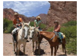
Mahlzeiten inklusive: Frühstück, Abendessen

Morgens erreichen wir mit dem Zug das schöne Städtchen Tupiza . Bei den hier herrschenden angenehmen Temperaturen können wir uns von der Kälte der letzten Tage erholen. Tupiza ist unter anderem berühmt dank der US Banditen Butch Cassidy und Sundance Kid, welche Anfang des zwanzigsten Jahrhunderts nach Südamerika zogen und in der Nähe ihr Unwesen trieben. Ihr Tun wurde von Hollywood mit Robert Redford und Paul Newman 1969 verfilmt. Am morgen können wir durch diese filmreife Kulisse schreiten und die Stadt auf eigene Faust erkunden. Am Nachmittag lernen wir die Umgebung kennen. In Jeeps fahren wir durch die von Canyons zerklüftete Landschaft und durchqueren immer wieder ein Bächlein auf dem Weg zum "valle de los machos", dem Macho-Tal, "la puerta del diablo", die Tür des Teufels und dem Geistergraben. Dort angekommen haben wir etwas Zeit die Schlucht zu erkunden. Nach der Wanderung bekommen wir eine Kostprobe der lokalen Spezialität Tamales , die hier in Bolivien aus Mais gemacht wird. Am Abend wartet etwas schmackhaftes auf uns - Lamm am Spieß , eine leckere regionale Köstlichkeit.