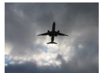
Mahlzeiten inklusive: Frühstück

Heute kommen Sie wieder in der Heimat an. Die vergangenen Tage und Erlebnisse werden Sie hoffentlich noch lange in schöner Erinnerung behalten... Genaue Informationen über die Ankunftszeiten finden Sie übrigens unter Termine und Preise.