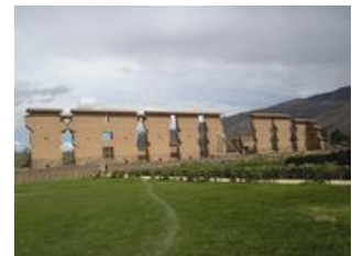
Mahlzeiten inklusive: Frühstück

Der Titicacasee erwartet uns! Um diesen zu erreichen, durchqueren wir das Altiplano , eine karge, wüstenähnliche Hochebene. Die abwechslungsreiche Landschaft mit den am Horizont auftauchenden Bergen und den vereinzelt kleinen Seengebietern in einer schroffen Umgebung lassen die Fahrt nicht langweilig werden. Wahrscheinlich begegnen uns auf unserer Fahrt auch einige Lamas, Alpakas, Vicuñas und Guanacos, die in aller Ruhe grasend am Wegrand stehen. Können Sie jetzt die Tiere nach den Erklärungen ihres Reiseleiters unterscheiden? Bis wir in Puno ankommen, besuchen wir noch einige Sehenswürdigkeiten. Der erste Stopp ist die Kapelle von San Pedro in Andahuaylillas. Diese ist durch ihre Fresken und Bilder auch als "sixtinische Kapelle der Anden" bekannt. Aber auch die Inkas treffen wir heute in den Tempelanlagen des Inka-Gottes Wiracocha in Raqchi wieder, bevor wir den Pass Abra la Raya auf erstmals über 4000m erreichen. Einen letzten Streifzug durch die Geschichte machen wir kurz vor Puno, wo wir in der Museumsstätte vieles Interessantes über die alte Kultur erfahren.