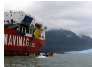
Mahlzeiten inklusive: Frühstück

Die Teilnehmer, welche das viModul Punta Arenas statt Navimag gebucht haben, treffen Sie am Abend im Hotel wieder.