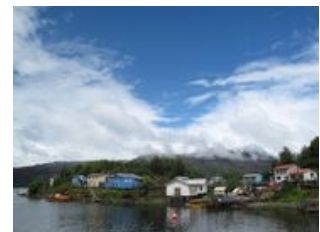
Mahlzeiten inklusive: Frühstück, Mittagessen, Abendessen

Während des Tages haben wir immer wieder traumhafte Aussichten! Neben zahlreichen Vogelarten wie Möwen und Albatrossen , werden wir mit etwas Glück an einigen Uferstellen auch Pinguine und Seelöwen entdecken können. Heute steht der einzige Halt der Route auf dem Programm. Die Navimag ankert am Fischerort Puerto Eden und wir erleben etwas vom Lebensstil in den Fjorden und von den letzten heimischen Kawesqarindianern . Am Nachmittag können wir den größten Gletscher Südamerikas, Pio XI , zu Gesicht zu bekommen. Dies ist jedoch stark wetterabhängig und kann nicht garantiert werden. Spektakulär sind die Fjorde, die wir durchqueren, jedoch trotzdem! Von der Kapitänsbrücke aus können wir gut die engen Passagen der Fjorde beobachten, welche die Navimag durchquert.