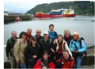
Mahlzeiten inklusive: Frühstück, Abendessen

Nach dem sehr frühen Check-In auf der Navimag haben wir Zeit, die Stunden bis zum Boarding entspannt im Puerto Montt zu verbringen und machen ein Besuch des Hafens Angelmo. Dort gibt es neben einem Fischmarkt unzählige urige Restaurants, wo wir überall die leckersten und frischesten Fische und Meeresfrüchte genießen können. Auch ein paar Einkäufe für die kommenden Tage auf dem Schiff können getätigt werden: Kekse, Schokolade, Wasser etc. - die Mahlzeiten auf dem Schiff sind alle inklusive und reichlich, aber bei Filmen oder Kartenspielen sind Kleinigkeiten zum Naschen immer Willkommen. Um ca. 16:00 Uhr verlassen wir den Hafen mit dem Frachter und setzen unser Patagonien Abenteuer fort.