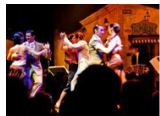
Mahlzeiten inklusive: Frühstück, Mittagessen

Abhängig vom Wetter und unserer Motivation können wir nach dem Mittagessen ein Verdauungsschlächchen in der Hängematte halten oder vom Steg aus ein erfrischendes Bad im zugegeben recht braun aussehendem Fluss nehmen. Wieder in Tigre geht es zurück nach Buenos Aires und können die restlichen freien Stunden zum Entspannen oder für eigene Entdeckungen nutzen.