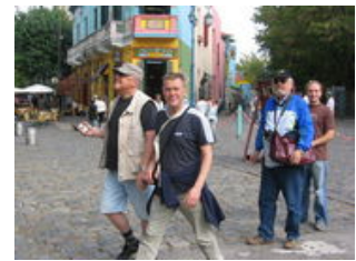
Mahlzeiten inklusive: Frühstück

Das angegebene Abendessen bezieht sich auf die Mahlzeit während des Fluges.