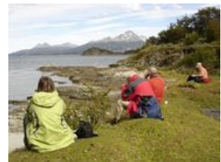
Mahlzeiten inklusive: Frühstück

Der heutige Tag steht ganz im Zeichen des Nationalpark Feuerlands . Wir laden Sie ein mit dem berühmten Ende-der-Welt-Zug in den Park einzufahren. Dort erwarten uns die verschiedensten Aktivitäten und Sehenswürdigkeiten. Wir fühlen uns versetzt in eine Märchenlandschaft: kleine Guindo-Bäume, farbenfrohe Lengas, abgestorbene Baumpfähle, Mooslandschaften und kleine Bäche prägen das Bild des Parks. Mit einem Motorboot fahren wir zur sogenannten runden Insel auf dem Beagle-Kanal . Nach einem wohlverdienten Mittagessen gibt es die Möglichkeit, ein wenig die Insel zu erkunden oder Siesta zu halten. Mit dem Boot geht es dann zurück auf festes Land, wo wir an der Bucht Lapataia das Ende der Panamericana besuchen. Nach der Rückkehr in Ushuaia steht der Nachmittag zur freien Verfügung. Ihr Reiseleiter gibt Ihnen gerne Tipps zur Freizeitgestaltung.