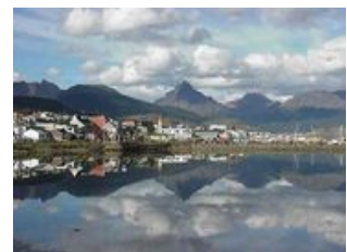
Mahlzeiten inklusive: Frühstück

Nachmittags sind wir wieder in Buenos Aires . Wer noch Lust und Energie hat, kann seine letzte Nacht in der argentinischen Hauptstadt gerne in einer Bar mit Tangoflair ausklingen lassen.