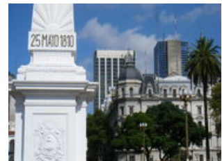
Mahlzeiten inklusive: Frühstück, Abendessen

Am Flughafen in Buenos Aires werden Sie von Ihrem viventura Reiseleiter empfangen. Der Flughafen liegt ca. 40km außerhalb von Buenos Aires, so dass wir auf der Fahrt zu unserem zentral gelegenen Hotel schon einen ersten Eindruck von der Hauptstadt Argentinien bekommen. Heute erkunden wir die Hauptstadt des Tangos . In der Millionenmetropole Buenos Aires strömt uns pures Südamerika-Flair entgegen. Unter anderem ziehen wir mit unserem lokalen Guide durch verschiedene Stadtteile, wie zum Beispiel Recoleta und San Telmo , die für ihre herrschaftlichen Kolonialstilhäuser bekannt sind. Wir finden uns in malerischen Straßen und zahlreichen Antiquitätenläden wieder und lernen die lebensfrohe und entspannte argentinische Lebensart besser kennen. Natürlich darf auch der Stadtteil La Boca nicht fehlen. Dieser bunte Touristenanziehungspunkt gilt als der Geburtsort des Tangos. Um am Abend neue Kräfte zu sammeln und uns besser kennenzulernen, laden wir Sie zu einem Willkommensessen mit einer ganz exklusiven Tangoshow nur für unsere Gruppe. Denn was wäre ein Besuch in Buenos Aires ohne Tango?