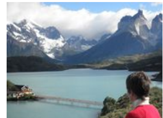
Mahlzeiten inklusive: Frühstück, Mittagessen, Abendessen

Früh am Morgen brechen wir zum Nationalpark Torres del Paine auf! Während der Fahrt können wir bereits beste Ausblicke auf das durch die Winde geformte Paine Massiv genießen (wetterabhängig). Ziel heute sind die wichtigsten Aussichtspunkte, wobei wir natürlich auch die vielfältige und artenreiche Flora und Fauna auf uns wirken lassen. Wir kommen am Pehoe See vorbei, von wo aus wir einen wunderschönen Blick auf die Cuernos del Paine (Hörner) und die Torres (Türme) haben. Wer möchte, kann im Anschluss eine ca. einstündige Wanderung zum Aussichtspunkt am Nordenskjöld See unternehmen. Bei entsprechendem Wetter hat man von hier eine besonders eindrucksvolle Sicht auf die Cuernos del Paine. Am späten Nachmittag fahren wir weiter zu unserer Unterkunft Hosteria.