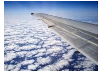
Mahlzeiten inklusive: Abendessen

Die angegebenen Mahlzeiten beziehen sich auf die Gerichte während des Fluges.