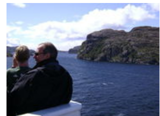
Mahlzeiten inklusive: Frühstück, Mittagessen, Abendessen

Die N/V Magallanes war früher ein reines Frachtschiff. Vor wenigen Jahren wurden nach und nach auch Kabinen angebracht, denn die Route durch die Fjorde Patagoniens ist voll von Überraschungen und bei jedem Wetter sehenswert. Sie können sich so richtig entspannen an Bord und jeden Morgen gibt es ein kurzes Briefing zum Tag, nachmittags meistens einen Film und abends nette Musik. Zudem gibt es Vorträge , die sich mit der Geschichte, der Natur und den Sehenswürdigkeiten der Region beschäftigen. An Bord stehen auch einige Brett- und Kartenspiele zur Verfügung - einfach nachfragen! Natürlich sollten Sie sich nicht den großartigen Blick auf die Natur von der Reling aus entgehen lassen. Das Motto ist: Entspannung in der reizvollen Umgebung Patagoniens!