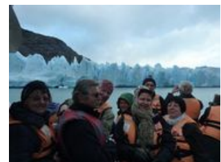
Mahlzeiten inklusive: Frühstück, Mittagessen, Abendessen

Unser heutiges Highlight ist der Grey Gletscher . Ganz früh starten wir mit dem Bus zum Ablegeplatz der Fähre, die uns zum Gletscher bringt. Auf der Fahrt haben wir wieder einen guten Ausblick auf das Paine Massiv und können die ersten schwimmenden Eisbrocken, die uns entgegenkommen, bestaunen. Bei der Rückfahrt über den See fahren wir direkt an der 30m hohen Abbruchkante des Gletschers entlang. Ein tolles Erlebnis! Am späten Nachmittag fahren wir zurück zu unserer Hosteria, wer möchte kann in der weiten Gegend noch spazieren gehen.