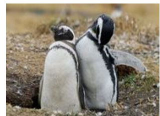
Mahlzeiten inklusive: Frühstück

Ein patagonischer Tag steht auf unserem heutigen Programm. Zuerst besuchen wir eine der ersten Estancias von Feuerland. Die Estancia Harberton wurde 1886 gegründet und liegt seither im Besitz der Nachfahren. Nicht nur das Leben auf einer Estancia erleben wir hautnah, sondern auch das Museum Acatushun werden wir uns ansehen. Verschiedene Skelette von Vögeln und Wirbeltieren der südlichen Meere sind hier ausgestellt. Die Estancia liegt direkt am Beagle Kanal und von hier aus nehmen wir Boote um zur Isla Martillo zu gelangen. Hier können wir die kleinen Magellan Pinguine aus nächster Nähe beobachten. Wir werden vieles über die Lebensweise der Pinguine, aber auch die der Albatrosse und der Kormorane erfahren. Wussten sie beispielsweise, dass die Magellan Pinguine in einer Wassertiefe von ca. 50m jagen? Auf dem Weiterhart nach Ushuaia fahren ganz nah an die Felsinseln heran und passieren die Isla de los Pajaros, eine Insel voller Kormorane und patagonischer Möwen . Weiter geht es an Seelöwen vorbei, bevor wir am Leuchtturm Les Eclaireurs vorbeifahren. Am Abend kehren wir in unsere Unterkunft zurück und genießen eine unserer letzten Nächte in Argentinien.