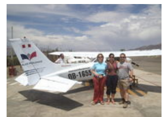
Mahlzeiten inklusive: Frühstück

Ein straffes Programm voller Highlights erwartet uns! Ausgeruht beginnen wir diesen mit dem Besuch einer Bodega , in der uns der Herstellungsprozess des Nationalgetränks Pisco gezeigt wird. Ganz besonderen Spaß macht uns aber vor allem die Verköstigung nach dem Rundgang. Gut gelaunt geht es auf der Panamericana weiter in Richtung Süden nach Nazca. Der Ort und seine Umgebung haben sich vor allem einen Namen, durch die in den Steinboden geschnittenen Figuren und kilometerlangen Linien, gemacht. Auf dem Weg dorthin machen wir Halt am Maria Reiche Museum . Die Dresdnerin hat Ihr Leben den mysteriösen Nazca-Linien gewidmet, sie fotografiert, vermessen und letztendlich versucht zu interpretieren. Von einem Aussichtsturm bekommen wir einen ersten Eindruck der Wüstenzeichnungen. Anschließend fahren wir weiter zum Flughafen von Nazca und starten unseren Rundflug über die Linien . Da man die wahren Ausmaße der Linien nur von oben erahnen kann, ist dieser Flug bei uns inklusive. Am Abend empfehlen wir den Besuch des Planetariums in Nazca, die Tickets organisieren wir gerne für Sie.