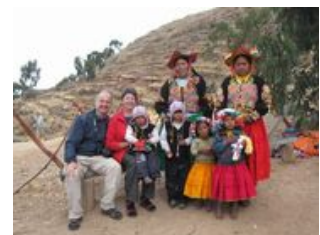
Mahlzeiten inklusive: Frühstück, Mittagessen, Abendessen

Bevor es Richtung Titicacasee losgeht, besuchen wir das von viventura unterstützte Sozialprojekt in El Alto: das Jugendheim Luz de Esperanza. Unser Weg führt weiter über Copacabana , dem heiligsten Ort Boliviens. In Bolivien ist es Gewohnheit in diesem Dorf sein Auto weihen zu lassen - sodass ein Großteil der bolivianischen Fahrzeuge hier Gottes Segen empfangen hat. Die Grenze erreicht, wechseln wir den Bus und fahren am Titicacasee entlang bis nach Puno. Das Boot wartet bereits und bringt uns über den See auf die Halbinsel Capachica. Wir nutzen die Gelegenheit, um uns auf dem Wasser mit der Seeluft um die Nase bei einem kleinen Picknick zu stärken. Wo uns unsere Gastfamilien, bei denen wir übernachten werden, herzlich empfangen. Mit unserem Besuch unterstützen wir drei der hiesigen Gemeinden . Die Gemeinden haben ihren ganz eigenen Charme, weshalb wir uns entschlossen haben, die Nacht auf dieser Halbinsel zu verbringen. Seit kurzer Zeit gibt es sporadisch Strom und vereinzelt fließendes Wasser. Hier auf Capachica können wir richtig relaxen und die Natur und Gastfreundschaft der Bewohner genießen.