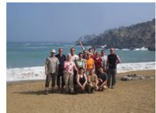
Mahlzeiten inklusive: Frühstück

Eine längere Fahrt steht uns bevor, doch wir werden nicht auf unseren Plätzen festwachsen. Regelmäßige Pausen sorgen für genug Bewegung. Der erste Stopp ist ein alter Nazca Friedhof, an dem uns unser lokaler Guide über den Hintergrund der riesigen Gräber und der dazugehörigen Mumien aufklärt. Wir erfahren auch, welche Rolle Grabräuber spielten und es bis heute tun. Wieder im Bus geht es entlang des Pazifiks über Camana in Richtung Arequipa. Wir passieren viele schöne Strände und legen am Strand von Puerto Inka eine Pause ein. In dieser schönen Bucht am Pazifik, in der noch kleine Überreste eines alten Inkahafens zu finden sind, haben wir genügend Zeit ein Bad im kalten Nass zu nehmen! Aber Vorsicht - man unterschätzt den Pazifik leicht! Erfrischt sitzen wir wieder im Bus in dem wir am Abend Arequipa (2.335m) erreichen.