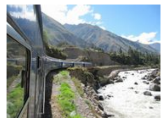
Mahlzeiten inklusive: Frühstück

Es ist 8 Uhr morgens und schon sitzen wir im Bus auf den Weg zu den Ruinen von Pisac . Wir durchqueren das Heilige Tal und passieren auf dem Weg zahlreiche Aussichtspunkte mit beeindruckendem Blick auf das Tal und Saqsayhuaman. Anschließend fahren wir weiter nach Urubamba und Ollantaytambo (2.800m). Auch dieser Ort war nicht unberührt von den Inkas, so dass es weitere Ruinen gibt, die auf unseren Besuch warten. In Ollantaytambo können wir gut nachvollziehen, wie die Inka die Steine hergebracht und bearbeitet haben. Auf Schienen kommen wir von Ollantaytambo nach Aguas Calientes (2.400m). Es geht während der zweistündigen Zugfahrt fast nur bergab, den Höhenunterschied erkennt man leicht an der Veränderung der Vegetation. In Aguas Calientes, zu Füßen von Machu Picchu ist es schon subtropisch. Hier übernachteten wir aus Mangel an Alternativen in einem 2-Sterne-Hotel. Doch dank eines satten Programmangebots werden wir sowieso nicht viel Zeit in unseren Zimmern verbringen: Die Wanderlustigen können auf dem legendären Inkatrail dem heiligen Pfad nach Aguas Calientes folgen. Heute nehmen wir nur das Tagesgepäck mit dem Nötigsten für eine Nacht mit. Das Hauptgepäck bleibt im Hotel in Cuzco.