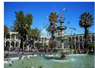
Mahlzeiten inklusive: Frühstück, Mittagessen

Der Rundgang durch Arequipa bietet uns eine erste Orientierung in der Stadt. Wir besichtigen das Zentrum mit dem bekannten Santa Catalina Kloster. Der Plaza de Armas stellt den Hauptplatz der Stadt dar und verlockt zum verbleiben bei einer Tasse Kaffee. Die weißen Häuser die den Platz umgeben, stehen im Kontrast zu den sonst gleichfarbenden Häusern Perus. In der großen Markthalle San Camilo probieren wir verschiedenste peruanische Früchte und Spezialitäten und können die skurrilsten Dinge bestaunen. "viventura ist persönlich" lautet einer der Kernwerte. Bei einem gemeinsamen Mittagessen im Büro der "Macher" Ihrer Reise haben Sie die Gelegenheit, die Mitarbeiter in Arequipa mit Fragen zu löchern und den einen oder anderen Insider Tipp zu entlocken. Das Essen wird verfeinert mit Live-Musik durch den Komponisten José, der auch den viventura-Song schrieb. Der Nachmittag steht zur freien Verfügung. Wir empfehlen einen Besuch bei "Juanita". Die Mumie eines Inkamädchens, das 1995 in den Anden gefunden wurde, war einer der wichtigsten Funde in Amerika der letzten Jahrzehnte. Das Mädchen war ein Menschenopfer an den Berg Ampto, von dem die Inka glaubten, dass er für das Wasser auf der Erde Sorge.