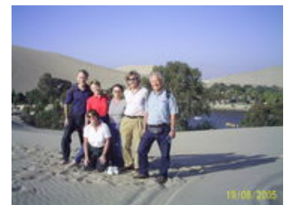
Mahlzeiten inklusive: Frühstück

Es heißt Abschied nehmen von Lima und schon am frühen Morgen fahren wir auf der Panamericana Richtung Süden. Vom Pazifikhafen des Ortes Paracas bringt uns ein Boot zu den Ballestas Inseln . Neben Seelöwen, Kormoranen, Blaufuß- und Maskentölpeln, Pelikanen und Pinguinen können wir mit etwas Glück sogar Delfine beobachten. Wegen ihrer Artenvielfalt gelten diese Inseln auch als "Klein-Galapagos". Im Anschluss besuchen wir das Paracas Naturreservat , das vor allem für die bekannten Felsformationen berühmt ist. Am Nachmittag kommen wir in der Oase Huacachina an. Sie ist von einem unendlich scheinenden Dünenmeer umgeben und ist ein herrlicher Ort zum Entspannen. Wer es gerne rasant mag, kann hier ein ganz besonderes Abenteuer erleben: mit einem Buggy geht es durch die Sanddünen. Das Modul Buggytour beinhaltet auch Sandboarden. Hier geht es, einmal oben auf der Düne angelangt, ähnlich dem Snowboardfahren, mit Hilfe eines Brettes wieder runter. Alternativ besteht die Möglichkeit in Ica ein etwas anderes Museum zu besuchen (vor Ort ca. 5 Euro/Person). Gezeigt werden Steine mit eingravierten Figuren, die mit dem untergegangenen Atlantis in Verbindung gebracht werden. Das Museum öffnet allerdings nur auf Anfrage.