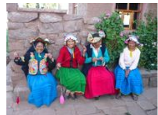
Mahlzeiten inklusive: Frühstück, Mittagessen

Wer Lust hat, kann am Vormittag eine kleine Wanderung unternehmen, doch unterschätzen Sie die Höhe nicht. Zum Mittag nehmen wir Platz am Tisch der Menschen der Gemeinde, die uns ein typisches Mahl zaubern. Es bleibt Zeit den Charme der Insel zu erleben und den Dorfbewohnern bei ihrer Arbeit zu zuschauen. Diesen Nachmittag lernen wir ein neues Volk kennen: die Uros . Mit dem Boot setzen wir über auf eine der schwimmenden Schilfinseln , auf denen sie leben. Der Stamm nutzt das Titicacaseeschilf "Totora" zum Bau der Inseln und auch Häuser und Boote werden daraus gefertigt. Allerdings haben sich viele Uros ganz dem Tourismus verschrieben, ihre Inseln mit Motorbooten direkt in die Bucht von Puno ziehen lassen und ihre eigene Kultur völlig verloren. Wir werden jedoch eine Familie besuchen, die abseits des Tourismus lebt und ihre Traditionen pflegt. Nach dem Besuch der schwimmenden Inseln fahren wir weiter nach Puno (3.830m), wo wir übernachten.