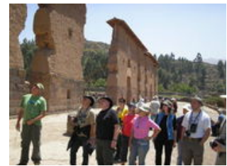
Mahlzeiten inklusive: Frühstück

Von Puno aus fahren wir mit dem Bus nach Cuzco. Auf der beeindruckenden Strecke durch das Altiplano durchqueren wir das Vilcanota-Massiv. Auf dem La Raya Pass (4.313m), dem höchsten Punkt der Strecke, machen wir eine kurze Pause bevor wir unsere Fahrt in das 3.300m hoch gelegene Cuzco fortsetzen. Vor der Ankunft in Cuzco schauen wir den Ruinenkomplex von Raqchi an - eine archäologische Stätte, die uns einen kleinen Vorgeschmack auf die Bauten der Inka gibt. Am Nachmittag kommen wir in der Inkahauptstadt an, so dass wir am Abend Gelegenheit haben, unsere ersten Eindrücke von Cuzco zu sammeln.