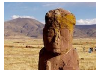
Mahlzeiten inklusive: Frühstück

Nach dem Frühstück fahren wir entlang des Titicacasees in Richtung Bolivien. Auf dem Weg passieren wir zahlreiche bunte Ortschaften und haben einen Panoramablick über den atemberaubenden See. Bei Desaguadero überqueren wir die bolivianische Grenze und wechseln unseren Bus. Nach einer weiteren halben Stunde Fahrt gelangen wir zu den Ruinen von Tihuanacu , die von der UNESCO zum Weltkulturerbe erklärt wurden. Anschließend geht es weiter nach La Paz, das auf über 3.600 Metern liegt. Auf dem Weg dorthin durchqueren wir den berühmten Vorort El Alto, bevor wir auf den Kessel La Paz herabblicken können. Unser Busfahrer gibt sein Bestes, damit wir passend zum Sonnenuntergang ankommen, so dass wir die angestrahlten Häuser der Stadt, sowie den dahinterliegenden Hausberg Illimani bestaunen können. Wir beziehen unser Hotel, machen uns frisch und für alle Willigen geht es ab in das Nachtleben der Hauptstadt.