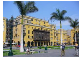
Mahlzeiten inklusive: Frühstück, Mittagessen

Morgens kommen Sie am Flughafen in Lima an, wo Ihr Reiseleiter Sie bereits erwartet. Nach einem gemütlichen Happen kann unser Südamerika Erlebnis beginnen! Die peruanische Hauptstadt Lima hat geschichtlich und kulturell einiges zu bieten und wir starten direkt mit unserer Citytour : Wir besuchen zunächst das San Francisco Kloster mit seinen beeindruckenden Katakomben und auf dem berühmten Plaza de Armas können wir das typische lateinamerikanische Großstadtflair genießen. Im Laufe des Tages besichtigen wir die Stadtviertel Barranco und Miraflores . Hier probieren wir auch zum ersten Mal auf unserer Reise die gute peruanische Küche bei unserem Willkommensessen. Der Rest des Tages steht zur freien Verfügung, damit Sie die Millionenstadt individuell erkunden können. Ihr Reiseleiter gibt Ihnen gerne Tipps zur Gestaltung Ihrer freien Zeit.