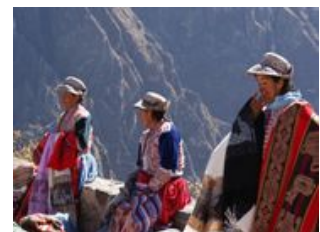
Mahlzeiten inklusive: Frühstück

Auf geht es ins Colca Tal , einer der tiefsten Canyons der Welt! Auf dem Weg dorthin halten wir bei einer Alpaka-Pullover Manufaktur . Die vorort hergestellten Pullover gehören zu den besten der Welt. In Europa kostet so ein Pullover ein Vermögen, hier können wir jedoch wahre Schnäppchen ergattern. Abermals auf der Straße passieren wir den Vulkan Misti, das Wahrzeichen Arequipas, und den 6.000er Chachani. Die Landschaft ist hier besiedelt von wilden Vicuñas, Lamas und Alpakas, die ein optimales Fotomotiv abgeben. Nachdem Überqueren eines 4.921m hohen Passes, dem höchsten Punkt unserer Reise, geht es auf einer spektakulären Straße zum Örtchen Chivay (3.650m). Das Dorf hat einen interessanten Markt über den wir schlendern. Im Anschluss können wir die Thermalquellen von Calera (ca. 3 EUR) besuchen, sie sind ein modernes, sauberes Thermalbad, das in eine beeindruckende Landschaft gebettet ist. Wer nicht schwimmen gehen möchte, kann sich die Zeit im kleinen ethnischen Museum vertreiben. Gut entspannt machen wir uns auf den Weg nach Cabanaconde (3.300m) und lassen den Abend gemütlich ausklingen.