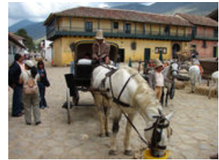
Mahlzeiten inklusive: Frühstück

Nach dem Frühstück geht es in die Umgebung von Villa de Leyva - und zwar hoch zu Ross! Durch eine eindrucksvolle Landschaft, an blauen Lagunen vorbei, in immer karger werdende Wüsten, reiten wir zu präkolumbianischen Zeugen ihrer Zeit. Im Fossilienmuseum bekommen wir einen Eindruck, wie es vor Millionen von Jahren in der Umgebung ausgesehen hat. Wer noch ein typischen Mittagessen - corrientaso - genießen möchte, kann dies tun bevor wir auf eigene Faust durch die engen Gassen wandeln. Dabei erleben wir das einzigartige Flair von Villa de Leyva und besichtigen einige seiner kolonialen Schätze.