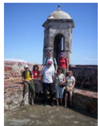
Mahlzeiten inklusive: Frühstück, Abendessen

Der Tagesausflug zum Nationalpark "Islas del Rosario" ist nicht inklusive und kostet vor Ort ca. 25 EUR.