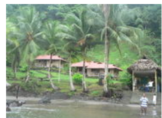
Mahlzeiten inklusive: Frühstück, Mittagessen, Abendessen

Heute fliegen wir von der Metropole Bogota in die Abgeschiedenheit am Pazifik - unser Ziel: die Ökolodge El Cantil . Am Morgen geht es zunächst nach Medellin. Dort bleibt Zeit sich mit Rum und Snacks zu versorgen und zu frühstücken, bis es in einer 15-Sitz Propellermaschine weiter in Richtung des 3000-Seelen-Dorfes Nuqui geht. Wir genießen den spektakulären Flug über die Anden, hinunter in eine der unerschlossensten Küstenregionen des tropischen Amerikas. Die kolumbianische Pazifikküste gehört zu den artenreichsten Gebieten der Welt. In Nuqui erwartet uns bereits die Mitarbeiter der Lodge. Auf einem kleinen Spaziergang vom Flughafen zum Hafen bekommen wir einen ersten Einblick über das kleine Tropendorf. Mit einem Boot geht die Fahrt südwärts weiter parallel zur Küste bis zur Urwaldlodge . Diese liegt direkt auf einer kleinen Anhöhe am Pazifik mit kilometerlangen, feinen Sandstränden und dichtem tropischen Regenwald dahinter. Am späten Nachmittag können wir erste Erkundungen in der Umgebung machen und vor allem den Strand genießen!