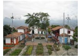
Mahlzeiten inklusive: Frühstück, Abendessen

Heute Vormittag erwartet uns mit der Eroberung des Cerro Nutibara, einer Erhebung im Herzen von Medellin, ein weiteres Highlight der Stadt. Auf dem Hügel haben wir die Gelegenheit im malerischen, nach historischen Vorbild nachgebildeten Dorf Pueblito Paisa in die Geschichte der Region rund um Medellin einzutauchen und ganz nebenbei einen weiteren unvergesslichen Blick auf die Stadt des ewigen Frühlings zu genießen. Auf dem Weg Richtung Süden legen wir einen Zwischenstopp am Grab des berühmten Pablo Escobars ein. Mit dem Bus geht es weiter und wir haben noch einen langen Fahrttag bis zur Kaffee-Finca bei Armenia vor uns. Hier können wir Wäsche waschen und uns auf zwei Tage ohne längere Fahrten und vielen Aktivitäten freuen. Am späten Nachmittag erreichen wir die Hacienda in Calarca, wo wir die frische Luft auf und den Duft der gerösteten Kaffeebohnen genießen können. Natürlich lädt auch noch ein frischer "Tinto", wie die Kolumbianer ihren schwarzen Kaffee nennen, zum Verkosten ein. Gegen Abend können wir in der Stille der Hacienda ein ausgiebiges Abendessen genießen.