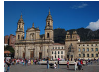
Mahlzeiten inklusive: Frühstück, Mittagessen

Die angegebenen Mahlzeiten Frühstück und Mittagessen beziehen sich auf die Mahlzeiten im Flugzeug.