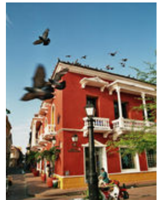
Mahlzeiten inklusive: Frühstück, Abendessen

Das angegebene Abendessen bezieht sich auf die Mahlzeit im Flugzeug.