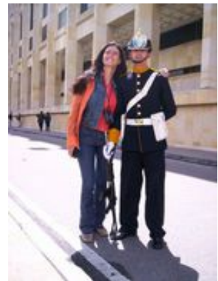
Mahlzeiten inklusive: Frühstück, Abendessen

Am Abend geht es in die Zona Rosa in das bekannteste Grill-Restaurant Kolumbiens, das "Andres - Carne de Res" . Zona Rosa beschreibt in den kolumbianischen Metropolen die Viertel, in denen sich das Nachtleben konzentriert. Das Grillrestaurant selber verwandelt sich nach dem Essen in eine der angesagtesten Tanzlokale der Stadt. Hier können wir zum einen eine sagenhafte Mahlzeit genießen und gleichzeitig erste Eindrücke des musikalischen Nachtlebens Kolumbiens bekommen.