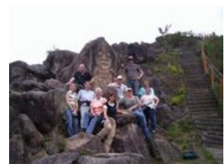
Mahlzeiten inklusive: Frühstück

Am Vormittag machen wir einen Ausflug zu Pferd. Die sanften Tiere sind gehfreudig aber sehr gehorsam, so dass auch Anfänger Vertrauen in die Tiere gewinnen können. Unsere Route führt uns vom Dorf aus durch fantastische Landschaften bis zur Chaquira-Schlucht in der anthropomorphe Standbilder in den Fels geschlagen sind. Bei gutem Wetter reiten wir bis zur Fundstelle El Tablon , an der es noch farbige Figuren zu sehen gibt. Der Nachmittag steht zur freien Verfügung, es gibt verschiedene Möglichkeiten ihn individuell auszufüllen. Für die Geschichts-Interessierten bietet sich ein Ausflug zum archäologischen Park San José de Isnos an - es ist die wichtigste Fundstelle, die außerhalb San Agustins liegt. Wer vom Reiten nicht genug bekommen konnte, kann den Nachmittag hoch zu Ross verbringen oder sich beim Raften in die Fluten des Rio Magdalena stürzen. Euer Reiseleiter unterstützt Sie gerne bei der Organisation.