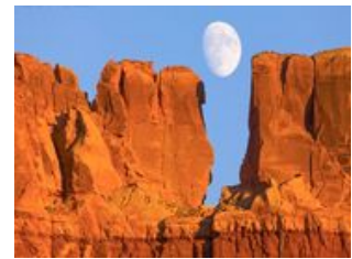
Mahlzeiten inklusive: Frühstück, Abendessen

Heute geht es hoch hinaus! Vor uns liegt der Bergpass "La Linea" auf ca. 3.300m Höhe. Da nur schlecht überholt werden kann, schiebt sich der Verkehr Stoßstange an Stoßstange hinter den schleppenden Lkws her. Das gibt den ansässigen Kindern die Möglichkeit, sich von den Brummis die Strecke in ihren "Seifenkisten" hochziehen zu lassen und vom höchsten Punkt zurück ins Tal zu düsen. Über diese wagemutigen Kinder wurden bereits zahlreiche Fernseh-Reportagen gedreht. Gegen frühen Nachmittag erreichen wir Neiva und haben etwas Zeit uns frisch zu machen. Danach startet unsere Tour in die Wüste. Die Tatacoa-Wüste war in der Pliozän (vor 3-5 Mio. Jahren) Teil eines Meeres und wurde von gewaltigen prähistorischen Tieren bevölkert. Heute ist sie von Gräben und Kanälen durchzogen und erinnert teilweise an eine Mondlandschaft . Im Laufe der Jahre haben Wind und Sonne kreative Formationskünste geleistet. Die Schattenspiele der Sonne, die großen Kakteen und der brausende Wind machen den Reiz der Landschaft aus. Bevor wir am Abend wieder nach Neiva fahren, besuchen wir noch das Wüsten-Observatorium und genießen dabei den fantastischen Sternenhimmel der sich uns bietet.