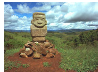
Mahlzeiten inklusive: Frühstück, Mittagessen

Nach dem Frühstück fahren wir entlang des Rio Magdalena, dem größten Fluss des Landes bis nach San Agustin, dem archäologischen Zentrum Kolumbiens. Hier liegt eine der wichtigsten, eindrucksvollsten und unerforschtesten Ausgrabungsstätten Südamerikas. In San Agustin hinterließ eine weit entwickelte Kultur monumentale Grabstätten und Hunderte von Steinskulpturen der Nachwelt. Diese Hochkultur hatte ihren Hauptsitz hier in den Anden, unweit der Höhenlagen der Páramos, wo die wasserreichsten Flüsse des Landes, der Rio Magdalena, Rio Cauca und Rio Caqueta entspringen. Nach der Ankunft am Mittag und einem Mittagessen bei unserem Schweizer Gastgeber, erkunden wir den archäologischen Park. Der Nachmittag steht ganz im Zeichen einer ausführlichen Besichtigung des archäologischen Parks von San Agustin, der zwei Kilometer hinter dem Dorf beginnt. Die Hochblüte dieser Kultur war wahrscheinlich in der Zeit bis zum 10. Jahrhundert n. Chr. Die Leistungen der San Agustin-Kultur im handwerklichen und künstlerischen Bereich und in der Steinbearbeitung sind bei den damals vorhandenen primitivsten Mitteln eine absolute Spitzenleistung.