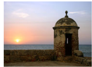
Mahlzeiten inklusive: Frühstück, Abendessen

Ein letztes Erwachen mit dem Blick auf die Karibikstrände des Nationalparks und ein letztes Frühstück im Paradies. Vom ökologischen Highlight der Tour brechen wir auf zum kulturellen - Cartagena. Eine Fahrt mit einem öffentlichen Bus gehört zu einer Reise durch Südamerika einfach dazu, da es das typischste Verkehrsmittel für die Kolumbianer ist. Das Gepäck ist sicher und der Komfort höher als man denkt. Wir fahren über Santa Marta zur Perle der Karibik. Am späten Nachmittag erreichen wir Cartagena , eines der Highlights Südamerikas. Unser Hotel befindet sich im ehemaligen Matrosenviertel - ein Teil der Altstadt, die von meterhohen Befestigungsmauern umgeben ist. Cartagena ist anders als jede andere Stadt Kolumbiens: ein Schmelztiegel aus Kolonialstilhäusern, karibischem Flair und afrikanischem Einfluss. Von der Stadtmauer aus, genießen wir im berühmten "Café del Mar" den Sonnenuntergang und den einen oder anderen Cocktail.