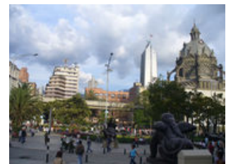
Mahlzeiten inklusive: Frühstück, Abendessen

Nach dem Frühstück heißt es Abschied nehmen vom Pazifik. Mit dem Boot geht es entlang der Küste zurück nach Nuqui und unterwegs sehen wir mit etwas Glück Delfine. Am Nachmittag treffen wir in Medellin, der Stadt des ewigen Frühlings ein. Da die Flugzeiten auch vom Wetter abhängen, kann die Ankunftszeit variieren. Bei einer Stadtführung erfahren wir viel über die Geschichte und Gegenwart von Medellin. Dabei darf auf keinen Fall die Besichtigung der "Dicken" von Fernando Botero , einem der bedeutendsten kolumbianischen Künstler, fehlen. Sie laden zur Aufnahme von Schnappschüssen ein.