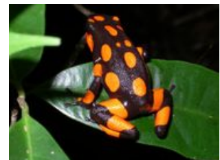
Mahlzeiten inklusive: Frühstück, Mittagessen, Abendessen

Heute startet das Dschungelabenteuer. Nach einem stärkenden Frühstück sind wir bereit für den Urwald . Wir starten eine kurze und leichte Wanderung. Wer sich stark genug fühlt, kann aber auch den Weg zu den Pfeilgiftfröschen wagen. Die Indios nutzten früher das Gift der kleinen Frösche für ihre Giftpfeile. Wir begnügen uns allerdings damit, die schwarz-rot-, -gelb- oder -grün-gepunkteten Frösche zu fotografieren. Die kleinen Pfade bergauf und -ab sind teilweise etwas rutschig und matschig. Und wie der Name Regenwald schon sagt, kann es dort auch kräftig regnen. Unterwegs klärt uns der Guide auch über Schlangen und Spinnen auf und wie man sie vermeiden kann. Nach ca. fünf Stunden kommen wir - zwar etwas schmutzig, aber dafür mit großem Hunger - wieder in unserer Lodge an. Den Nachmittag nutzen wir zum Erholen und Relaxen in der Lodge oder am vorgelagertem Strand. Wer noch unternehmungslustig ist, kann gegen einen Aufpreis ein Surfbrett, ein Kajak oder Windsurf-Ausrüstung mieten.