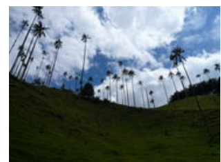
Mahlzeiten inklusive: Frühstück, Abendessen

Wir fahren durch die Kaffeezone nach Salento , von wo aus sich das Cocora-Tal erstreckt. Bekannt ist das "Valle de Cocora" durch die dort vorkommende Wachspalme , die 1985 zum Nationalbaum Kolumbiens erklärt wurde. Wir machen eine Wanderung, die ca. vier Stunden (kann aber auch abgekürzt werden) dauert und bis zum Bergnebelwald hinauf führt. Am späteren Nachmittag können wir Salento auf eigene Faust entdecken. Salento ist eines der schönsten Dörfer Kolumbiens. In einer kleinen Werkstatt dürfen wir unsere Phantasie freien Lauf lassen und selbst Souvenirs herstellen : Armbänder, kleine Ketten, Schlüsselanhänger und vieles mehr. Wenn wir heute noch genug Zeit finden, legen wir auf einer Kaffee-Finca nach einer Führung und Demonstration selber als Kaffeepflücker Hand an. Im Anschluss rösten wir Kaffeebohnen selbst und können ein Päckchen als Souvenir erwerben. Wer es am Abend noch "Knallen" lassen möchte, der sollte das Tejo-Spiel ausprobieren, eine der ursprünglichsten Traditionen Kolumbiens (optional).