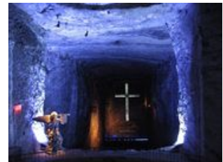
Mahlzeiten inklusive: Frühstück

Nach einem frühen Frühstück fahren wir zum Paso del Angel , dem Schritt des Engels! Wer über den schmalen Grat gegangen ist, wird den Namen verstehen. Die Landschaft ist großartig und der Rückweg entlang des Flussbetts ist mindestens genauso reizvoll wie der Weg über den Paso, und zum Baden bestens geeignet (wer es gerne frisch mag)! Danach geht es nach Zipaquira . Hier besichtigen wir die größte Untertage-Kathedrale der Welt , in den Salzminen der Stadt. Nachmittags fahren wir auf der Nordautobahn zurück nach Bogota und können am Abend auf die bevorstehenden Abenteuer anstoßen. Die nächsten drei Tage stehen dann für uns ganz im Einklang mit der grünen Pazifiknatur.