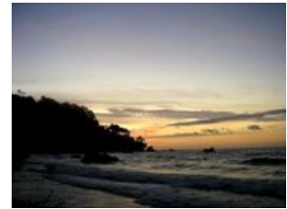
Mahlzeiten inklusive: Frühstück, Mittagessen, Abendessen

Am heutigen Vormittag machen wir einen Strandspaziergang zu einem nahe gelegenen Dorf. Nicht weit davon entfernt befindet sich eine natürliche Thermalquelle - warme schwefelhaltige Quellen neben einem erfrischenden Waldflüsschen, beide laden zu einem Entspannungsbad ein - die Wahl ist Ihre! Mit einem in dieser Gegend vorkommenden blauen Stein, der nach Zermalmen eine zähe Paste ergibt, unterziehen wir unseren Gesichtern einem Naturpeeling. Nach einer preisgekrönten Mahlzeit in unserer Herberge wechseln wir die Elemente: Am Nachmittag besteht die Möglichkeit einen Tauchgang im Pazifik zu unternehmen (nicht inklusive, vor Ort buchbar). Oder Sie ziehen die gemütliche Variante vor und genießen den Tag entspannt im El Cantil. Die Pazifikküste Kolumbiens gehört zu den ursprünglichsten Orten des Kontinents und bezaubert uns mit einzigartigem Flair. In der Zeit von Juni bis November besteht sogar die Möglichkeit Wale zu beobachten! Vor Ort kann eine fakultative Bootsfahrt hinaus zu den Walen organisiert werden.