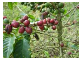
Mahlzeiten inklusive: Frühstück, Abendessen

Kaffee ist eines der wichtigsten Exportprodukte Kolumbiens und seine herausragende Qualität ist auch in Deutschland bekannt. Auf unserer Kaffeezonen-Finca haben wir die Möglichkeit bei schöner Aussicht das beliebte Getränk nicht nur selbst zu kosten sondern auch zu sehen wie der Kaffee in die Tasse kommt. Wir erleben hautnah den gesamten Kaffee-Herstellungsprozess . Ob das Pflücken in den Hügeln oder das anschließende Rösten und Mahlen der Bohnen wird uns faszinieren. Zum Schluß darf eine gute Tasse Kaffee nicht fehlen. Nach den vorherigen anstrengenden Tagen tut ein wenig Erholung am Pool oder mögliche Massagen im Spa gut. Der Nachmittag hat es dann wieder in sich: Wer möchte, kann an einer Canopy Tour (optional) in der Nähe der Finca teilnehmen und an langen Seilen gleitend über die Kaffeeplantage fliegen. Am Abend essen wir gemeinsam auf der Finca.