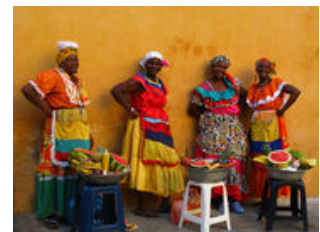
Mahlzeiten inklusive: Frühstück, Mittagessen

Nach einem Frühstück in den warmen Tropen lernen wir die Geheimnisse Cartagenas kennen. Die koloniale Altstadt , die von einer insgesamt elf Kilometer langen Befestigungsanlage umgeben ist, bietet unzählige historische Bauten. Von der beeindruckenden Festung San Felipe - sie liegt auf einem Hügel vor der Altstadt - haben wir einen großartigen Blick auf die Stadt und das karibische Meer. Ebenso vom Convento de la Popa , einem Konvent der augustinerischen Bettelmönche, welches 1607 gegründet und vom Papst Johannes Paul II. 1986 besucht wurde, bieten sich tolle Fotomotive. Der heutige Nachmittag steht zur freien Verfügung. Wer von uns das Nachtleben genießen möchte, sollte die Diskothek "Tu Candela" besuchen - dies ist aber nicht der einzige Ort zum Feiern in Cartagena.